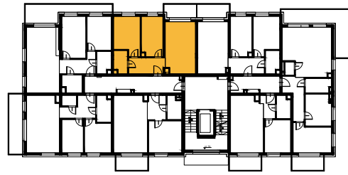
Schemat budynku Lokalizacja mieszkania