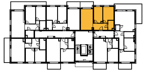
Schemat budynku Lokalizacja mieszkania